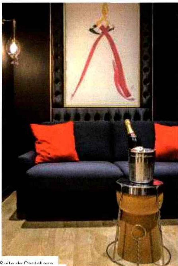
Suite de Castellane