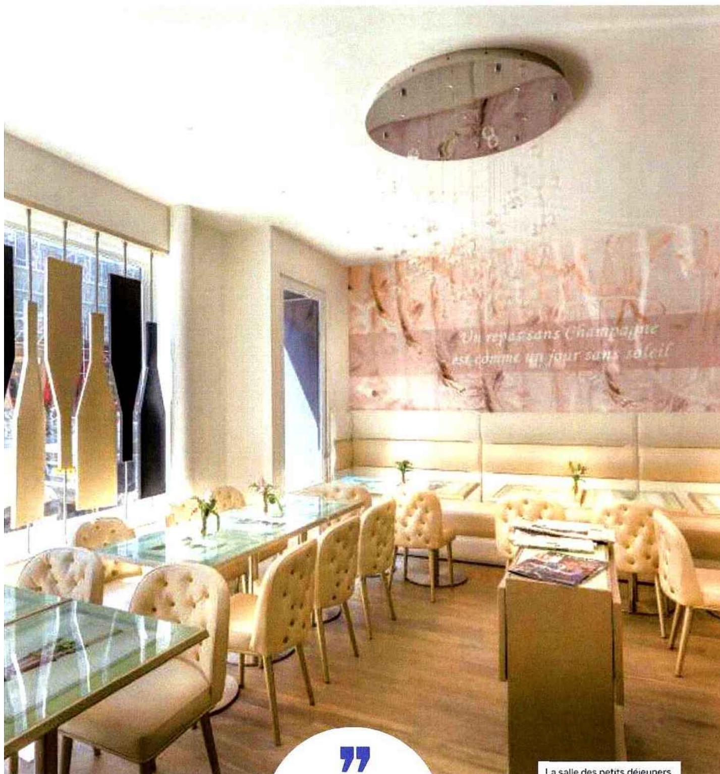
La salle des petits déjeuners.