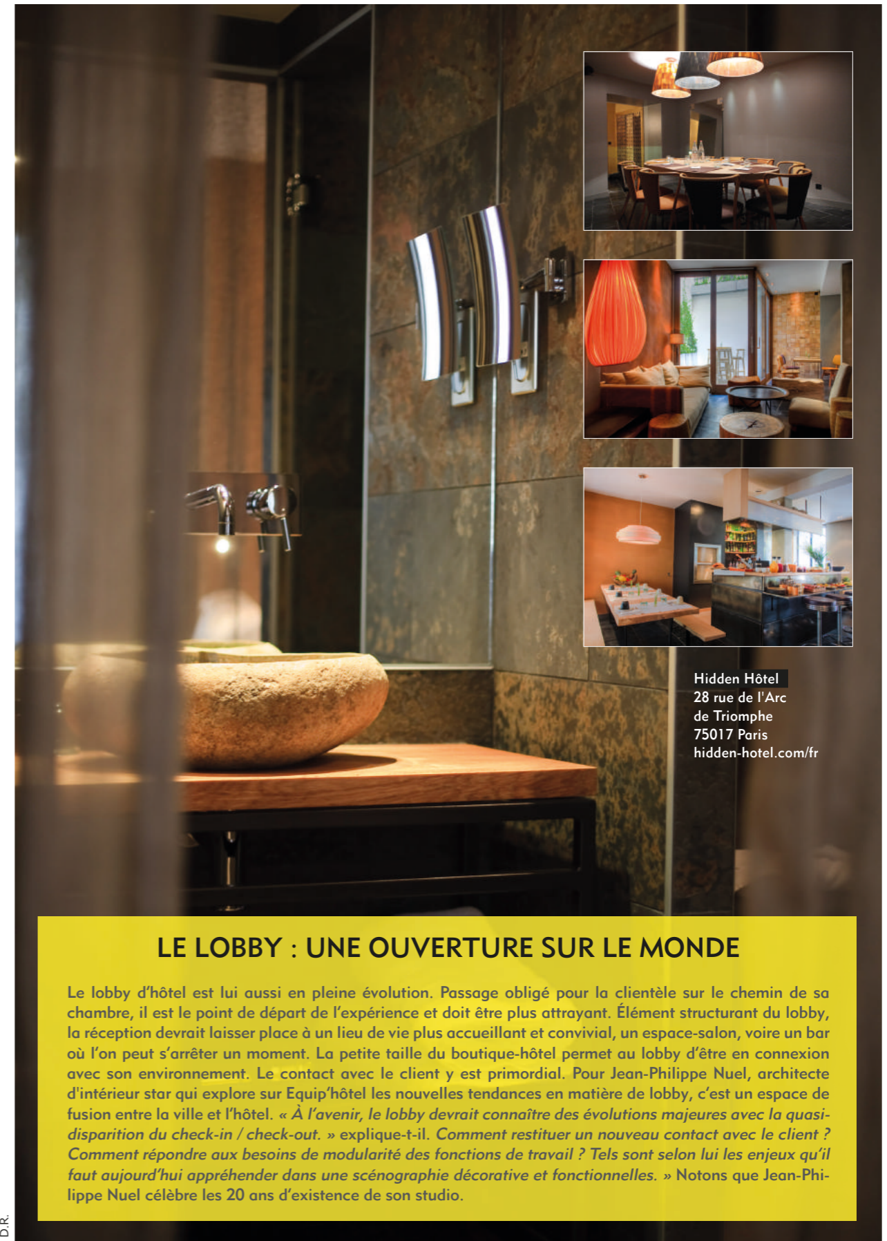
Hidden Hôtel 28 rue de l'Arc de Triomphe 75017 Paris hidden-hotel.com/fr