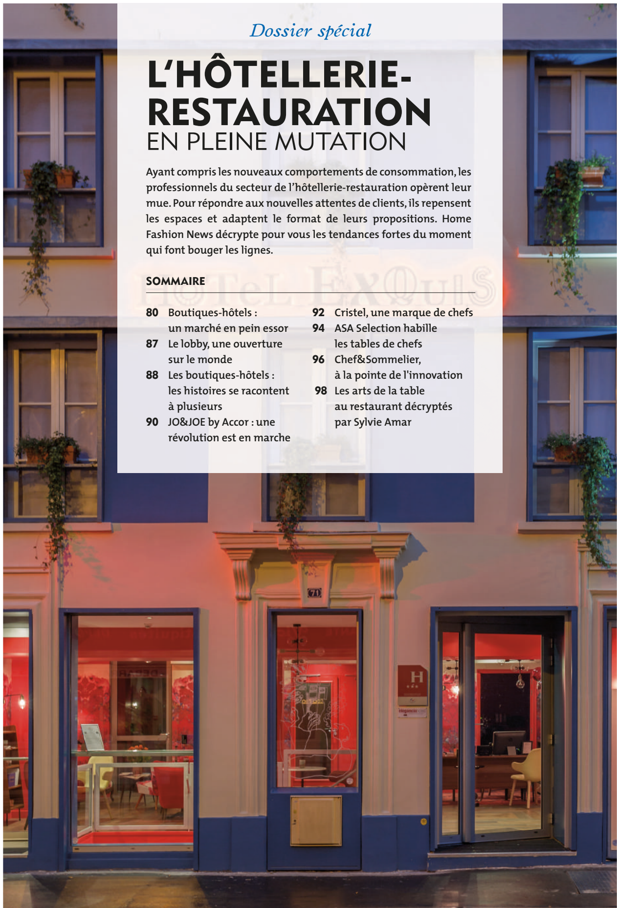
Hotel Exquis Paris