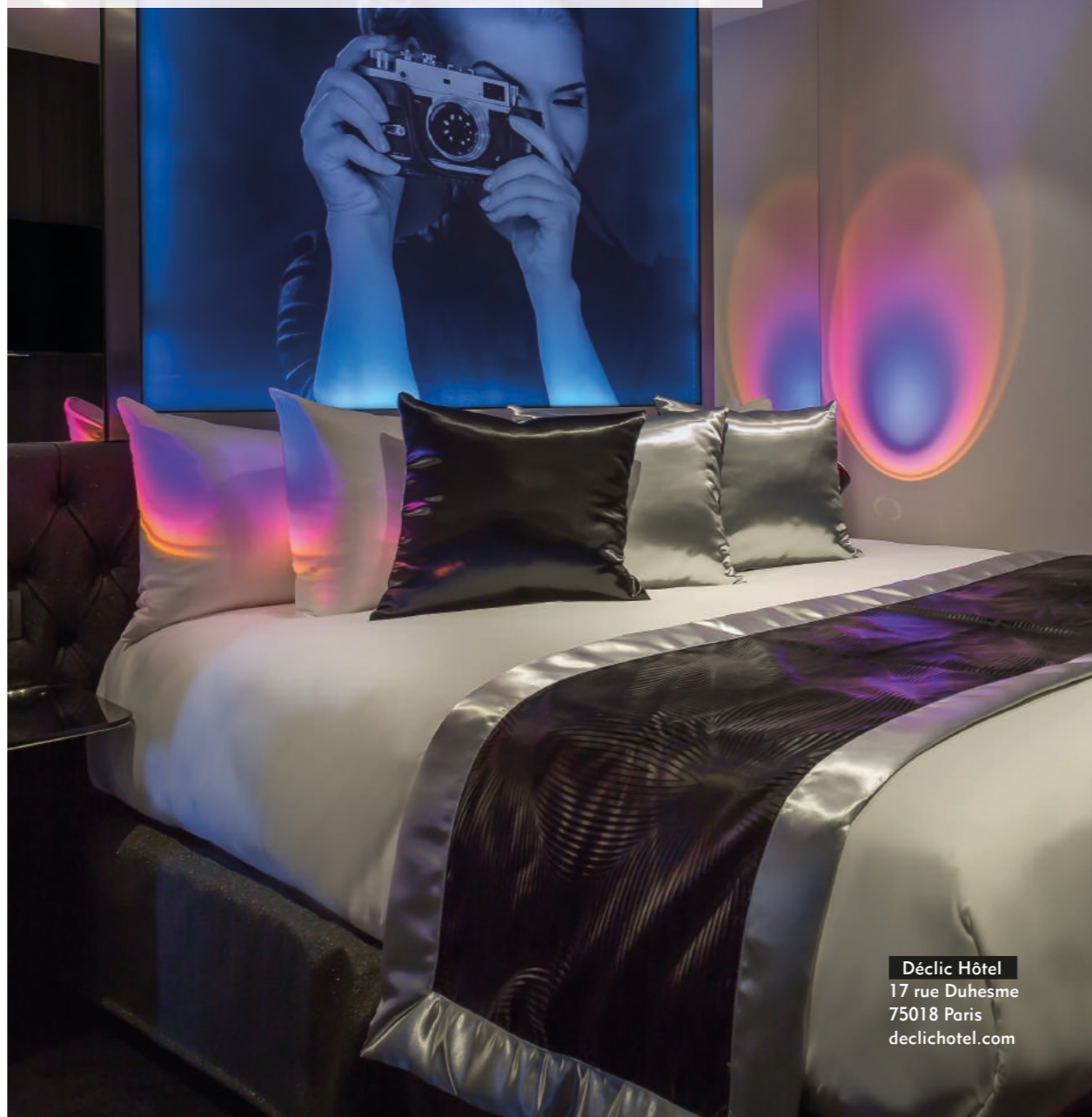
Déclic Hôtel 17 rue Duhesme 75018 Paris declichotel.com

En quoi consistent les boutiques-hôtels ? Comment expliquer leur succès et sont-ils toujours en vogue ? Home Fashion News a décrypté pour vous le concept de ces hôtels atypiques en rencontrant des personnalités qui contribuent à sa réussite.