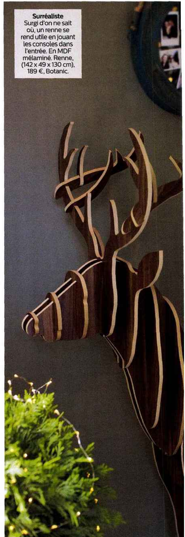
Surréaliste Surgi d'on ne sait où, un renne se rend utile en jouant les consoles dans l'entrée. En MDF mélaminé. Renne, (142 x 49 x 130 cm), 189 €, Botanic.