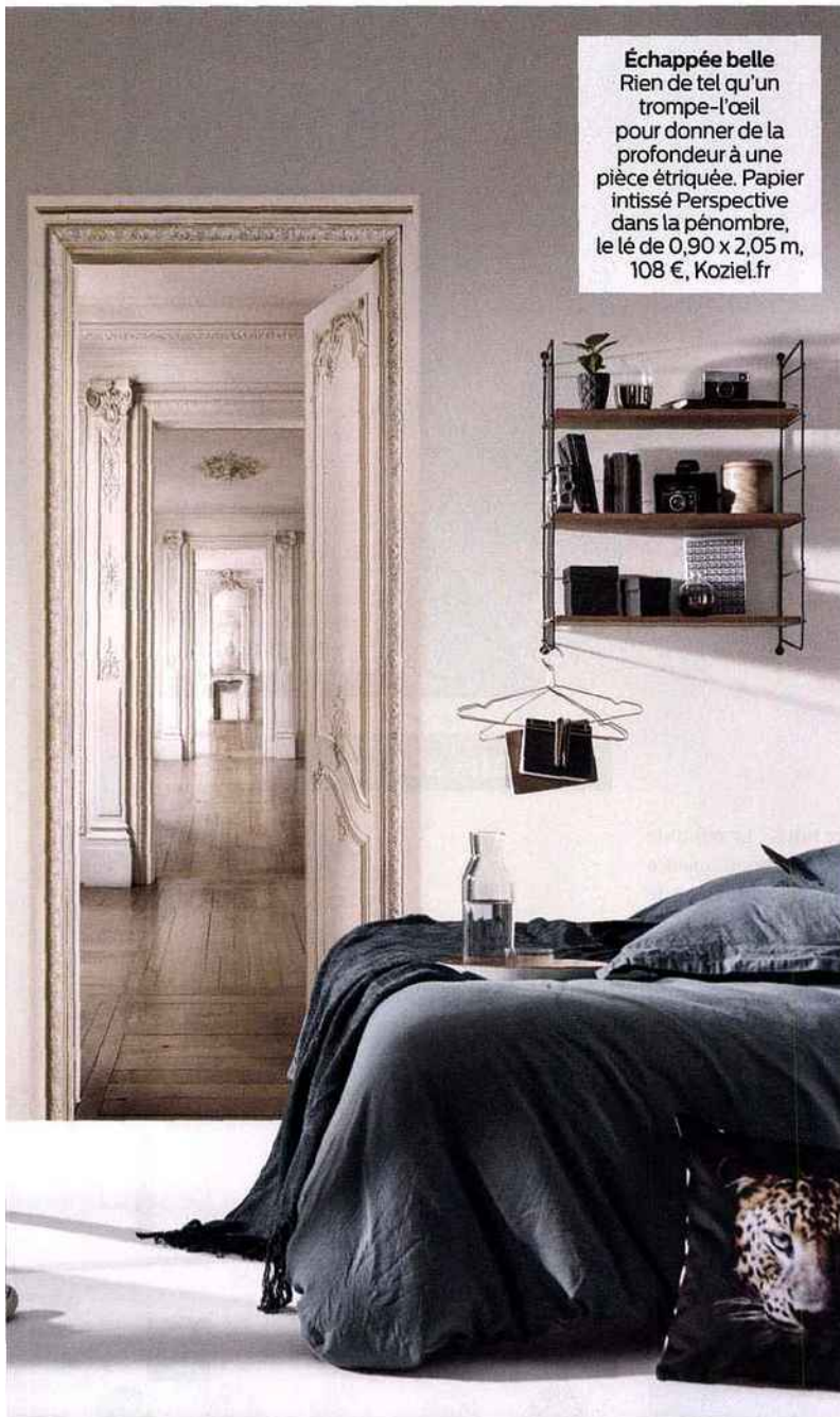
Échappée belle Rien de tel qu'un trompe-l'œil pour donner de la profondeur à une pièce étriquée. Papier intissé Perspective dans la pénombre, le té de 0,90 x 2,05 m, 108 €, Koziel.fr